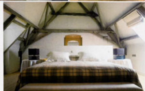
Op de bovenverdieping neemt de slaapkamer van de ouders de hele ruimte boven de voormalige stallen in, waardoor het lijnenspel van de balken mooi kan worden beklemtoond.

Vanop een afstand kun je aan deze hoeve in de Kempen niet zien hoeveel werk de huidige toestand heeft gekost. Je denkt dat gebouw en omgeving er netjes uitzien en dat alles pas een nieuw laagje verf heeft gekregen. Alleen de aanplantingen in de tuin lijken van recentere datum, als je de lindebomen met hun voor de streek typische snoeivorm niet meetelt.